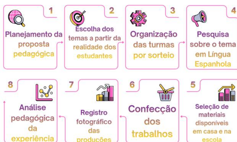
Figura 1 – Etapas de desenvolvimento dos projetos de Língua Espanhola no contexto do campo

Com o objetivo de explicitar o percurso das atividades e a intencionalidade pedagógica do trabalho desenvolvido, apresentam-se, a seguir, um fluxograma com as etapas do projeto e quadros de síntese referentes aos objetivos pedagógicos e às categorias temáticas identificadas na análise da experiência.