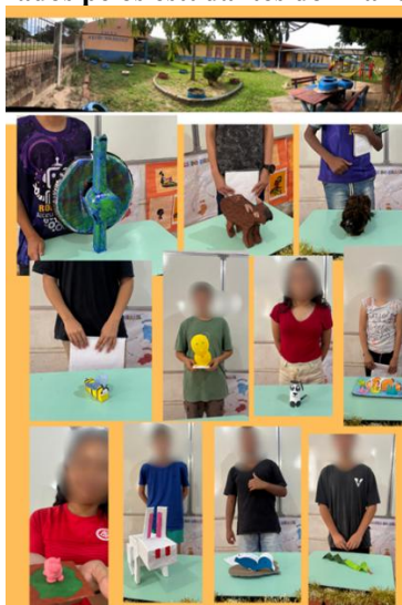
Figura 3 – Trabalhos confeccionados pelos estudantes do 7º ano sobre los animales de la granja .

As produções revelaram criatividade, zelo e forte participação dos estudantes. O processo de confeccionar os animais com materiais acessíveis tornou a aprendizagem mais concreta, favorecendo o protagonismo e a autoria discente. Mais do que memorizar palavras, os alunos puderam construir sentidos para o conteúdo estudado, reconhecendo que o idioma pode dialogar com a própria realidade em que vivem.